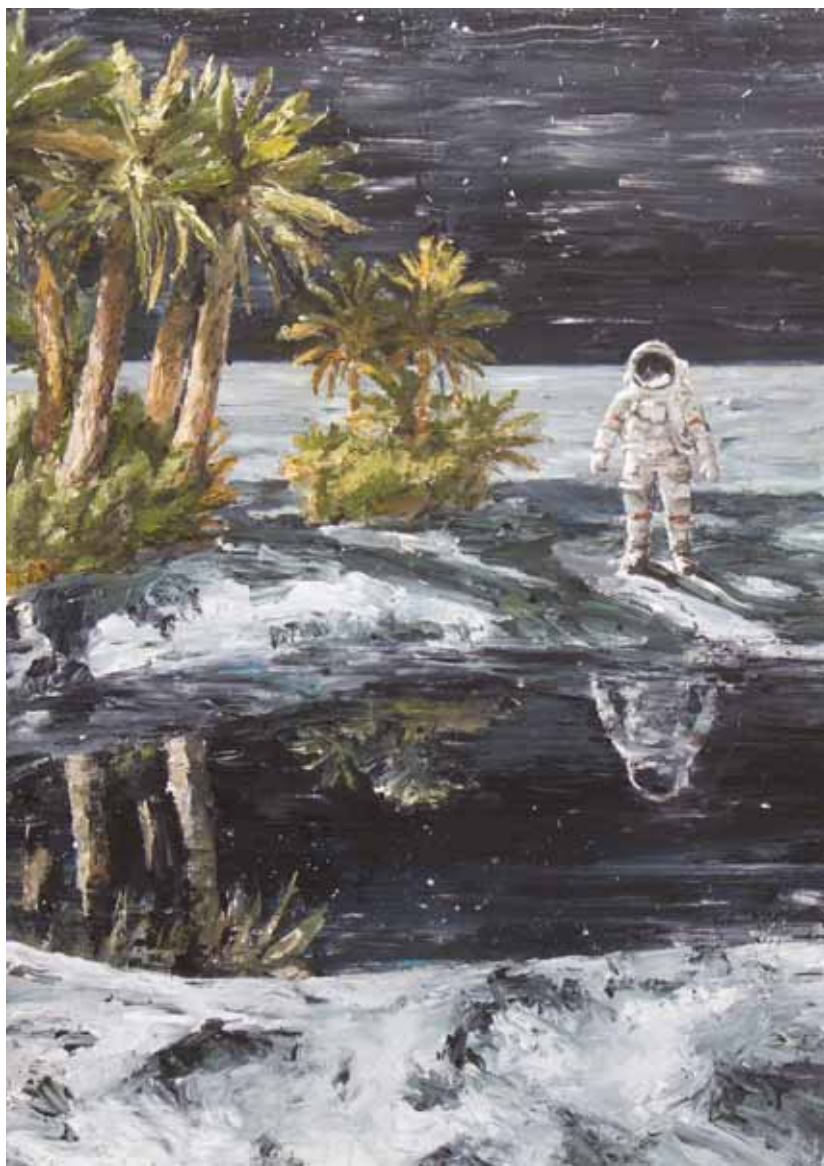
Heli García • Paisaje con astronauta • 130 x 195 cm • T. mixta sobre tela • 2015